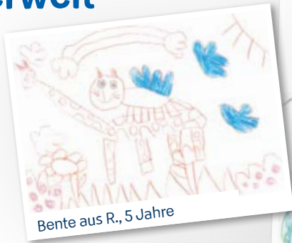
Bente aus R., 5 Jahre

Wir freuen uns auf die Meisterwerke der Kinder. Die drei schönsten Werke gewinnen jeweils 4 Tage im Casa Familia und hängen das ganze Jahr zum Bestaunen an der Kinderclub-Wand am Eingang.