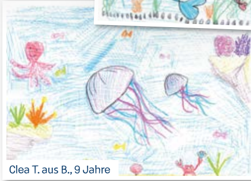
Clea T. aus B., 9 Jahre